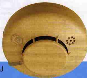
FSKJ216-B-J (ライトブラウン) オープン価格