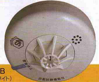
FSLJ006-B (ナチュラルホワイト) オープン価格