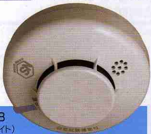
FSKJ216-B (ナチュラルホワイト) オープン価格