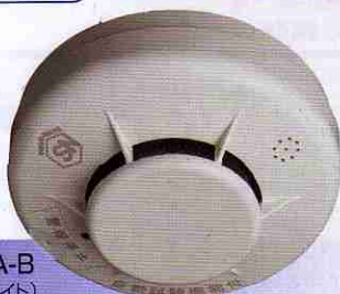
FSKJ206A-B (ナチュラルホワイト) オープン価格