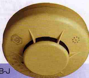
FSKJ206A-B-J (ライトブラウン) オープン価格