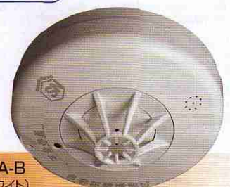
FSLJ002A-B (ナチュラルホワイト) オープン価格